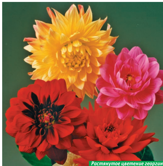
Растянутое цветение георгинов

– Этот номер журнала выходит в свет в начале марта. Так что будем считать, что выгонку тюльпанов и лилий к 8 Марта читатели этой рубрики уже освоили, срезку продали, и культивационные площади у них освободились.