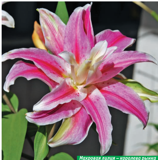
Махровая лилия – королева рынка

Начинаем расставлять на проращивание клубни георгин, бегоний, канн.