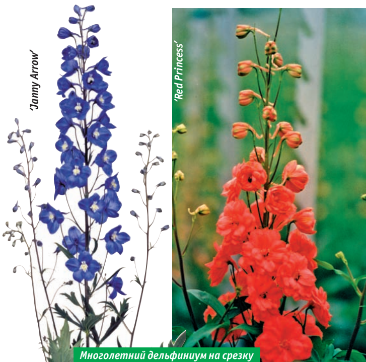
Многолетний дельфиниум на срезку

— При цене луковицы 65 руб. растение идет на рынке по