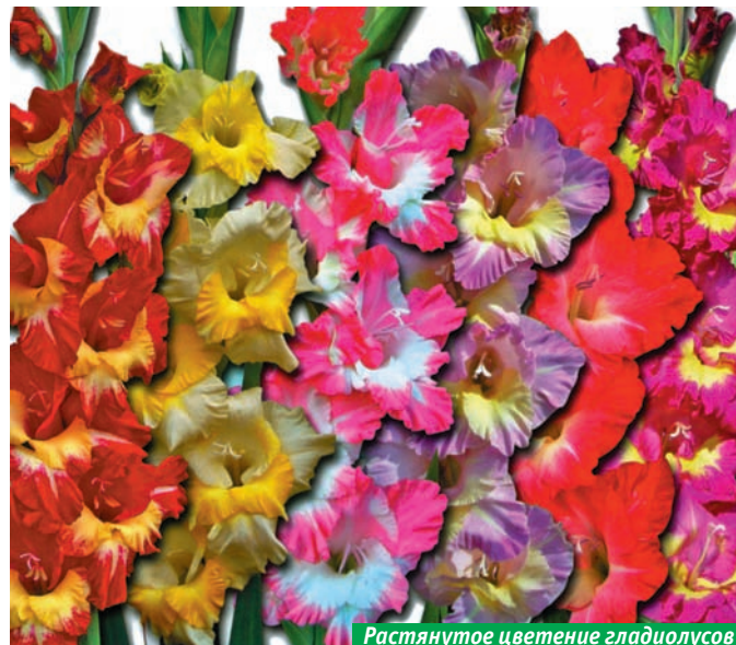
Растянутое цветение гладиолусов