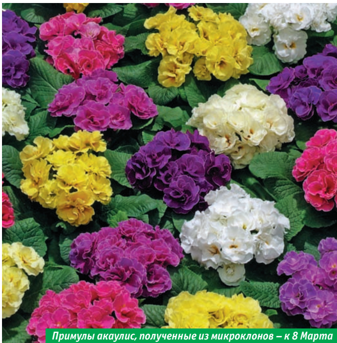
Примулы акаулис, полученные из микроклонов — к 8 Марта

— Одно из самых модных сегодня в мире направлений — выращивание многолетников на срезку. И если наши городские