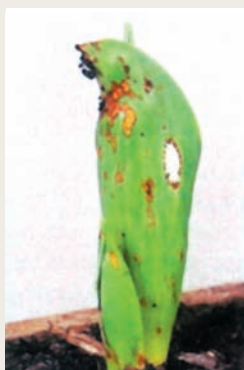
Гриб Rhizoctonia solani