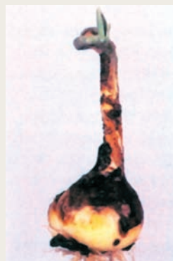
Гриб Botrytis tulipae

Причина: поражение стеблей серой гнилью, которая быстро распространяется при повышении температуры в теплице выше 15°.