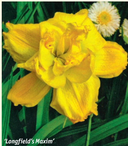
‘ Longfield’s Maxim ’