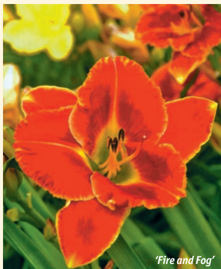
‘ Fire and Fog ’