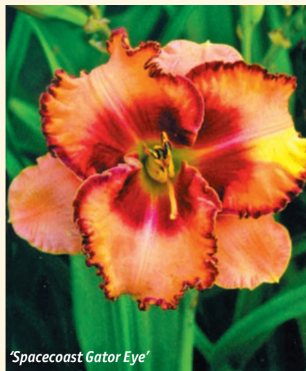
‘ Spacecoast Gator Eye ’