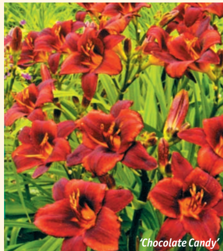
‘ Chocolate Candy ’