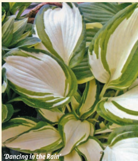
'Dancing in the Rain'