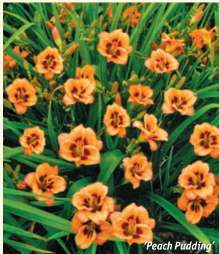
‘ Peach Pudding ’

Ценовая политика наших поставщиков базируется прежде всего на новизне сорта. Это мировая практика. Дороже, по 60–80 руб./шт., стоят и некоторые культуры повышенного спроса (гофре, махровые). В целом нам удалось выйти на при-