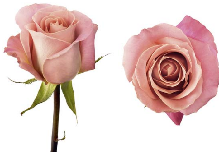
Красавица 'HERMOSA' — творение компании Lex+

необходимых признаков, как дискутировали со мной о достоинствах того или иного сорта. Мои собеседники стремились понять нашу идеологию, наш менталитет, чтобы выдвинуть свою «высокую идею» востребованного на нашем рынке сорта. А потом представители этого поколения стали уходить один за другим, руководство компаниями переходило к другим людям. Хорошо, если это были дети или соратники — наследники традиций, но чаще всего руководителями становились сторонние люди, которые сделали ставку на «эффективных менеджеров». А чем заканчивается деятельность таких «эффективных менеджеров», мы хорошо знаем. В лучшем случае возглавляемые ими селекционные компании начинают заниматься подражательством, пытаясь копировать триумфаторов