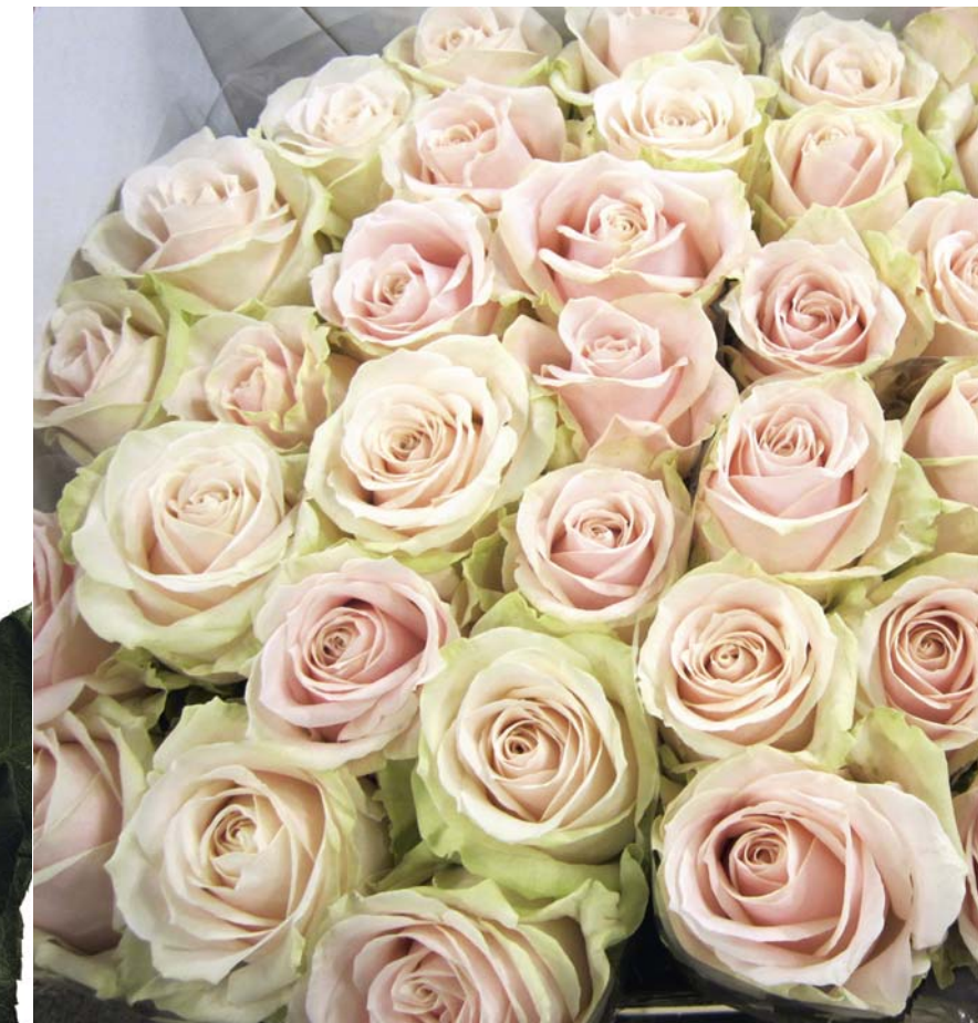
Шикарный букет из роз сорта 'AQUA' (компания Schreurs )