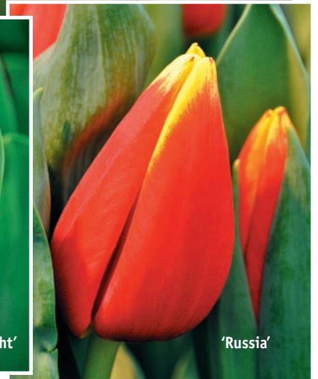
Фото всех упомянутых сортов можно посмотреть на сайте www.rolicvet.ru .